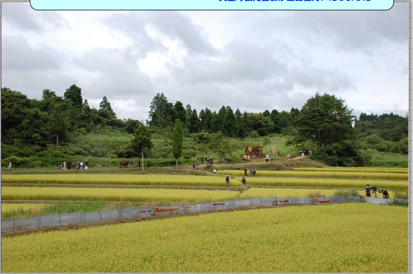
平成 20 年 8 月 30 日美星町三山東大迫地内でのロケ風景

平成 21 年 11 月末から 3 年間にわたり 12 月のNHK大河ドラマ枠で放映されている「NHKスペシャルドラマ『坂の上の雲』原作：司馬遼太郎氏」の美星町ロケが平成 20 年 3 月 25 日、平成 20 年 8 月 30 日の 2 回にわたり行われました。